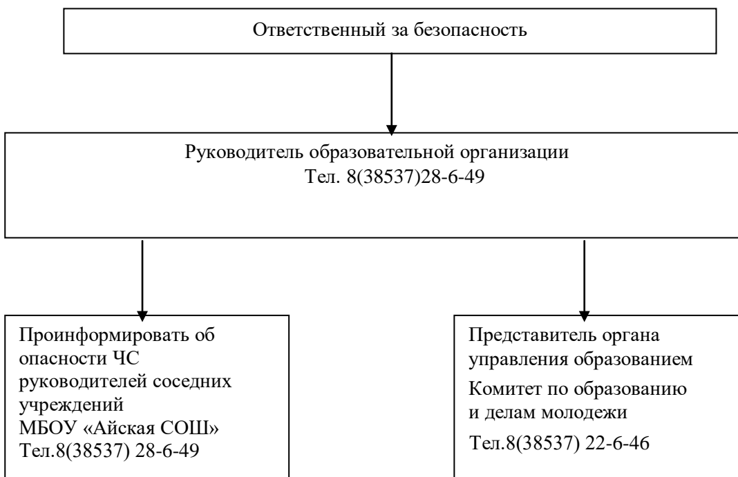
Схема оповещения и связи при ЧС